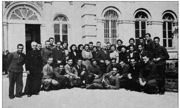
İsmail Hakkı Uzunçarşılı Edebiyat Fakültesi Zeynep Hanım Konağı'nın bahçesinde öğrencileriyle

manlı tarihini kapsar ve müstakil konular halinde yer alır. Hammer'in Osmanlı tarihinden geniş ölçüde istifade edildiği anlaşılan, Halil İnalçık'ın popüler tarih kategorisinde değerlendirdiği serinin ilk kitabının önsözünde Uzunçarşılı gördüğü kaynakları hisse mağlûp olmayarak tarafsız bir görüşle inceleyip göstermeye çalıştığını, olayların cereyan tarzını anlatırken ve bunlardan neticeler çıkarırken hakikatten ayrılmadığı zannında olduğunu belirterek bir ölçüde tarihe yaklaşımının ipuçlarını verir. Ayrıca Batı tarihçiliğinde Osmanlı tarihi üzerindeki yanlı ve kin duygusuyla yazılmış eserlere karşı duyduğu tepkiyi dile getirir, yapılan haksızlığa temas eder. Eserin I. cildi 1947'de Ankara'da basılmış olup Anadolu Selçukluları ve Beylikler'den itibaren Osmanlı Devleti'nin kuruluş devresini içine alır ve İstanbul'un fethine kadar gelir. Uzunçarşılı bu cildin sonraki basıklarına yeni bilgiler eklemiştir. II. cilt, İstanbul'un fethinden Kanûnî Sultan Süley-