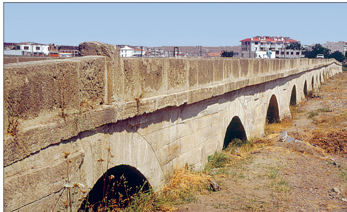
Uzunköprü – Silivri

Silivri'nin yaklaşık 1 km. batısında Silivri çayı üzerinde Mimar Sinan'ın eseri olan köprünün kitâbesi bulunmadığından inşa tarihi arşivde yer alan iki belgenin yardımıyla 975 (1568) olarak tesbit edilebilmektedir. Köprünün adı Tuhfetü'l-mi'mârîn ve Tezkiretü'l-ebniye 'de geçmektedir. Silivri çayını ve su baskınına uğrayan geniş bataklık araziye geçen köprü 333 m. uzunluğunda ve otuz iki gözlü inşa edilmiş, orta ayaklar fazla çıkıntı yapmadığından ince ve mükemmel bir perspektif sağlanmıştır. Böylece bütün gözleri bir arada görmek mümkündür. Mimar Sinan'ın eserlerinde karşılaşılan âbidevi tesir burada da mevcuttur. Köprünün çok uzun ve alçak olması sivri kemerin yerine burada basık kemerin tercih edilmesine yol açmıştır; kemer açıklıkları 7 m., ayak genişlikleri ise 3 m. civarındadır. Çevre taşları 50-60 cm. arasındadır. Kemerlerin iç yüzeylerinde uzunca taşlara rastlanmaktadır. Malzeme