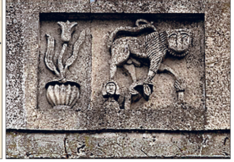
Uzunköprü'nün kesiti ve kısmi planı ile kitâbe köşkü çerçevesindeki figürlü taş süsleme

ğer yüzünde ise bir fil kabartması bulunmaktadır. Kemer kilit taşlarında altıgen bir çerçeve içinde küffi karakterde üç defa tekrarlanarak "Ali" adının baş harfleri ortada birleştirilmiş olup kemerlerden birinin kilit taşı üstünde bir çerçeve içinde "el-Mülkü lillâh" ibaresi yer almaktaydı. Köprünün doğu ucu yakınında mansap yüzünde, dörtgen bir çerçeveye kabartma olarak işlenmiş sekizgen içinde karşılıklı üçgenlerin meydana getirdiği bir yıldız ortasında ise yapraklı bir dal kabartması bulunmaktaydı. Ancak şehrin su ihtiyacını karşılayan su borusunun üzerlerinden geçmesi sebebiyle tahrip olmuştur. Bunların dışında köprünün sağında ve solundaki korkuluklara yerleştirilmiş yirmi sekiz adet yuvarlak taş görülmektedir. II. Murad, Cısr-i Ergene adıyla anılan bu yerleşime köprü ile cami, imaret, medrese, kervansaray, hamam, otuz üç dükkân, yağhâne, bozahâne, bezirhâne, mumhâne, üç çeşme ve iki su değirmeni inşa ettirmiştir. Yapılardan günümüze sadece köprü ile Murâdiye Camii, şadırvan, hamam ve Gazi Mahmud Bey Çeşmesi ulaşabilmiştir.