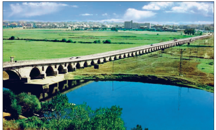
Uzunköprü – Edirne

Köprü ilk yapıldığında 1392 m. uzunluğunda ve 5,24 m. genişliğinde iken bugün uzunluğu 1238,55 m., genişliği 6,90 metredir. 174 gözden meydana gelen köprüde en büyük kemer açıklığı 14 metreyi bulmaktadır. Arazinin dolmasıyla günümüzde 164 gözü açık kalmıştır. Köprü kemerleri sivri ve yuvarlak olup 147 ve 148. kemerler diğerlerine oranla daha geniş ve yüksektir. Memba ve mansap taraflarındaki sel yarıklar üçgen şeklindedir, üzerlerinde yedi adet tahliye gözü vardır. Köprüde ana gözün üstünde bir tarih köşkü ve 40, 41 ile 102 ve 103. kemerlerin üzerinde iki balkon yer almaktadır. Köprü inşasından bugüne kadar Fâtiht Sultan Mehmed, II. Bayezid, II. Osman, II. Mahmud ve II. Abdülhamid dönemlerinde ve 1928, 1964, 1972 yıllarında onarım görmüştür. Evliya Çelebi'ye göre inşasından on dört yıl sonra yıkılan bir gözü onarılmıştır. II. Osman devrine ait tamiri hakkında Murâdiye Camii kitâbesinden bilgi edinilen köprünün tarih köşkünde II. Mahmud dönemi