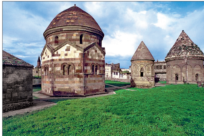
Erzurum'da Üç Kümbetler