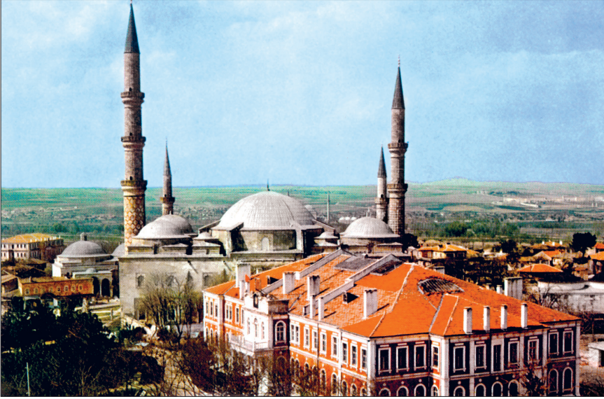
Üç Şerefeli Camii – Edirne

ri revakında, taçkapı eksenindeki kemerin aynalarında iki beyzî madalyon içinde yer almaktadır. Yakın zamanda da cami esaslı bir tamir geçirmiştir. Kareye yakın dikdörtgen planlı cami enine dikdörtgen planlı harim (60,41 × 23,90 m.) ve revaklı avludan (60,70 × 35,50 m.) meydana gelmektedir. Revaklı avlunun dört köşesine minare yerleştirilmiştir. Osmanlı mimarisinin merkezî planlı camilerinin ilk örneğini oluşturan yapı şadırvanlı-revaklı avlusuyla son derece önemlidir.