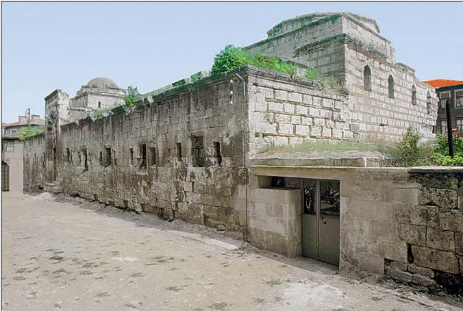
Peykler Medresesi – Edirne