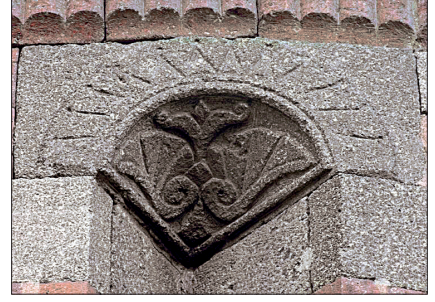
Üç Kümbetler'den bir taş süsleme detayı

Emîr Saltuk Kümbeti'nin güneydoğusunda yer alan ikinci kümbet Anonim Kümbet I olarak adlandırılmaktadır. Dört köşesi pahlı kare kaide üzerinde üç katlı silmeden sonra onikigen gövde yer almaktadır. Cephelerdeki kemerli düzenlemenin ardından silindirik gövdeli devam eden kümbet taş bir külâhla örtülüdür. Yapının cephelerinde köşelerde sade sütunçe başlıklarına sahip ince uzun çift sütunçeler silmeli sivri kemerlerle bağlanmıştır. Kümbete giriş batı yönündeki kapıyla sağlanmakta, kuzey ve güney cephelerinde köşeleri sütunçeli ve mukarnas kavsaralı pencereler bulunmaktadır. Silindirik kasnak kısmında kırmızı taş üzerine işlenmiş zencerek motifi bordür halinde dolanmaktadır. Yapının gövdesi içten silindirik olup kubbeyle örtülüdür. Altta kripta katının varlığı da bilinmektedir. İnşa tarihi kesin bilinmeyen yapı XIV. yüzyılın ilk çeyreğine tarihlendirilmektedir. Anonim Kümbet I'in hemen yanındaki üçüncü kümbet (Emîr Saltuk Kümbeti'nin güneybatısında) yine onikigen gövdeli ve taş külâhla örtülüdür. Kümbetin gövdesi her cephede silmelerle oluşturulmuş sivri kemerli düzenlemeyle hareketlendirilmiştir. Silindirik gövde burmalı bir halat silmeyle sonlanmaktadır. İnşa tarihi bilinmeyen bu yapı da XIV.