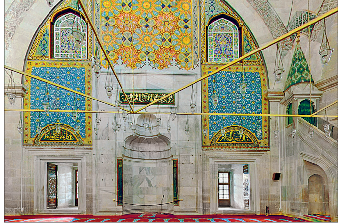
Üç Şerefeli Cami’nin mihrap duvarından bir görünüşü

Üç Şerefeli Cami’nin dört minaresi birbirinden farklı süsleme özelliklerine sahiptir. Camiye adını veren üç şerefeli minare harimin kuzeybatısındadır ve 6 m. çapında, 67,75 m. boyunda olup külâhla beraber yüksekliği 76 metredir. Birinci merdivenle birinci ve ikinci şerefeye, ikinci merdivenle ikinci ve üçüncü şerefeye, üçüncü merdivenle yalnız üçüncü şerefeye çıkılmaktadır. Zamanında en yüksek minare olması bakımından ayrıca çok önemlidir. On iki köşeli kaidesinin yüzleri silme çerçeveler içine alınmıştır ve Bursa kemerleriyle bezelidir. Kemerlerle çerçeveler arasında kalan yüzeylere kırmızı taş kakılmıştır. Daireye yakın çokgen gövde kırmızı taştan birbirine değen zikzaklarla bezelidir. Harimin kuzeydoğu köşesinde bulunan ve süsleme düzeninden dolayı “baklavalı minare” diye anılan minarenin Peykler Medresesi’nin yapımı sırasında Fâtihtan Sultan Mehmed tarafından inşa ettirildiği bilinmektedir. Kare kaideli ve iki şerefeli minarenin gövdesinde kırmızı ve küfeki taşından meydana gelen verev konumunda kareler yer almaktadır. Gövdesini helzon biçiminde saran kırmızı-beyaz iri kaval silmelerden dolayı “burmalı minare” diye adlandırılan tek şerefeli minare revaklı avlunun kuzeybatı köşesinde. 1176 (1762) depreminde hasar gören caminin Sultan III. Mustafa tarafından tamir ettirilmesi sırasında yaptırıldığı bilinen minarenin sekizgen kaidesinin beş kenarında mukarnaslı başlıklı mermer sütunçeler yer almaktadır. Üzerinde yüksek sivri kemerler bulunan ve ortalarında, kaş kemerli,