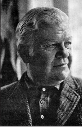
Sabri Fehmi Ülgener

li tebliğinde İslâmiyet'in faizi niçin haram kıldığını irdeledi. 1958-1959 akademik yılında Münih Üniversitesi'nde bulundu. 1964-1965 yıllarında misafir profesör olarak Columbia Üniversitesi'nde ders verdi. Türkiye'ye girişine ön ayak olduğu Keynesçi iktisadî, Alman tarihçi okulunun görüşünde yorumladığı az gelişmişlik olgusuyla birleştiren Millî Gelir, İstihdam ve İktisadî Büyüme adlı kitabını 1962'de yayımladı. Çeşitli makaleler yanında AK İktisat Ansiklopedisi 'nde elliden fazla madde yazdı. 1960'larda Türkiye'de baş gösteren olaylar münasebetiyle kaleme aldığı "Aydınlar Sosyolojisi" başlıklı yazısında Marksizm'e karşı eleştirel bir çıkış yaptı. 1981'de emekliye ayrıldı. 1 Temmuz 1983'te İstanbul Erenköy'de öldü ve Edirnekapı Şehitliği'ndeki aile sofasına defnedildi.