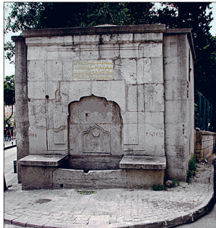
Üsküdar'da Başkadın Çeşmesi ile Solak Sinan Çeşmesi

Nazım, İstanbul Vilâyeti Şehremânetine Evkaftan Devrolunan Sular , İstanbul 1341, s. 57; İbrahim Hilmi Tanışık, İstanbul Çeşmeleri , İstanbul 1945, II, 253-480; Naci Yüngül, Üsküdar Üçüncü Ahmet Çeşmesi , İstanbul 1955; Kâzım