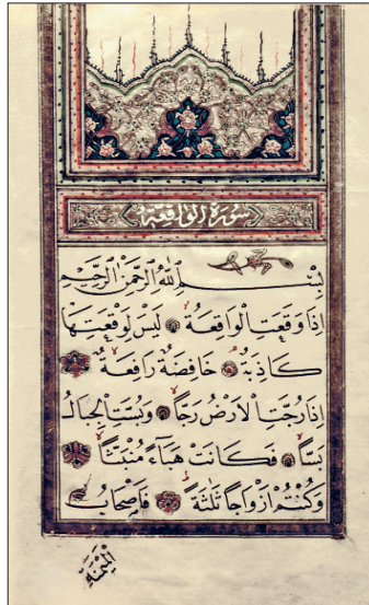
Vâkia sûresinin ilk âyetleri