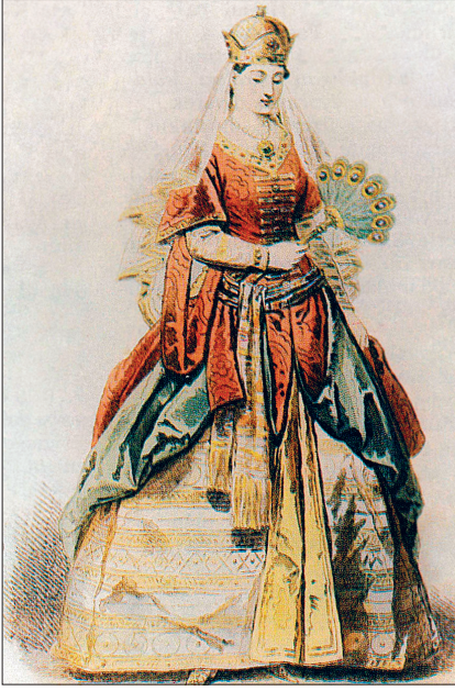
III. Mehmed'in annesi Safiye Sultan'ın temsili bir resmi

Mehmed Paşa'ya devrederek zamanını daha ziyade hayır işlerine ayırdı. Böylece IV. Mehmed'den sonra vâlide sultanların oğullarına nâibelik yapma dönemi, kadınlar saltanatı sona ermiş oldu. Bununla birlikte Gülnüş Emetullah Sultan da oğullarının üzerindeki nüfuzunu kullanıp zaman zaman devlet işlerine müdahale etti. 1703'te Şeyhülislâm Feyzullah Efendi aleyhinde başlayan olaylar esnasında II. Mustafa'nın şeyhülislâmından vazgeçmesi üzerine Gülnüş Sultan devreye girerek Feyzullah Efendi'yi görevden aldırması, ancak bu kararda geciken II. Mustafa 23 Ağustos 1703'te tahtı kardeşi III. Ahmed'e terketmek zorunda kalmıştı. Edirne'deki âsiler, II. Mustafa'yı yanlış yönlendirdiğini düşündükleri Gülnüş Sultan'ın tekrar vâlide sultan olarak Topkapı Sarayı'na yerleşmesine karşı çıktı. Fakat III. Ahmed'in bu davranışlarını sürdürmeleri durumunda tahtı bırakıp şimşirliğe geri döneceğini söylemesi üzerine âsiler bundan vazgeçti.