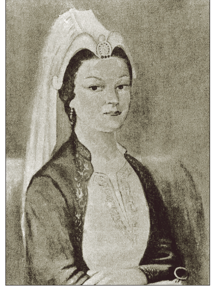
Kanûni Sultan Süleyman'ın annesi Hafsa Sultan'ın temsili bir resmi (P. Tuğlacı, Osmanlı Saray Kadınları , s. 291)

Gülnûş Emetullah Sultan hasekiliği zamanında Mekke'de bir dârüşşifâ ile hemen yanında Hasekiye İmareti'ni yaptırmıştır. Galata'da yanmış olan San Francesco Latin Kilisesi'nin arsasında 1696'da Yeni Vâlide Camii ile bir çeşme ve 1698'de Sakız adasında cami inşa ettirmiştir. 1120'de (1708) oğlu III. Ahmed döneminde Üsküdar'da inşasını başlattığı, cami, hünkâr mahfili, sebil, çeşme, türbe, muvakkithâne, imaret, sıbyan mektebi, çarşı, bedesten ve meşrutalardan oluşan Yeni Vâlide Külliyesi 1711'de tamamlanıp hizmete girmiştir. Açılıştan bir gün sonra harem halkı ve maiyetiyle birlikte camiyi ziyaret edip namaz kılan Gülnûş Sultan fakirlerle cami görevlilerine hediyeler dağıtmıştır. Ayrıca 1706'da Galata Bereketzâde sokağında, 1710'da Üsküdar İmam Nâsır sokağında iki çeşme yaptırmıştır. III. Ahmed,