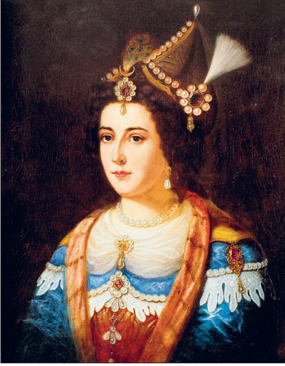
II. Mustafa ve III. Ahmed'in annesi Gülnûş Emetullah Sultan'ın temsili bir resmi

dana getirmiş, zor durumda kalanlara, hatta zaman zaman devlet hazinesine bile yardım etmişlerdi. Yapılan eserlerin ve faaliyetlerin bir kısmı vâlide sultanlıktan önceki döneme aittir. Mevcut bilgilere göre vakıf kuran ilk vâlide sultan I. Murad'ın annesi Nilüfer Hatun'dur. Bursa'da bir tekke, bir mescid ve kendi adıyla anılan çay üzerinde bir köprü yaptırmıştır. Ayrıca oğlunun 1388'de onun adına İznik'te inşa ettirdiği bir imareti vardır. II. Bayezid, annesi Gülbahar Hatun için 21 Zilkade 898 (3 Eylül 1493) tarihli vakfiye ile Tokat'ta imaret, medrese ve camiden oluşan bir külliye yaptırmış, bunlara zengin gelirler vakfetmiştir. Gülbahar Hatun da Sorukuoğlanı köyünde bir cami inşa ettirmiştir (VGMA, Defter, nr. 740; vakfiyenin Türkçesi için bk. nr. 1989). Kanûni Sultan Süleyman'ın annesi Hafsa Sultan'ın en önemli eseri Manisa'da 929'da (1523) tamamlanan ve cami, medrese, hankah, sıbyan mektebi, imaret, hamam, dârüşşifâdan teşekkül eden Sultâniye (Hafsa Sultan) Külliyesi'dir. Hamam ve dârüşşifâ binaları 1538 ve 1539'da oğlu tarafından yaptırılmıştır. O döneme kadar sadece padişahlara ait olan ve bu yapı ile Hafsa Sultan'a da tanınan iki minareli cami yapma imtiyazı oğlunun ona verdiği değer için açık bir işarettir. Vakfiyesinden Hafsa Sultan'ın Ur-la'da da bir mescidinin olduğu anlaşılmaktadır. Nurbânû Sultan da eser bırakan vâlidelerden biridir. En önemli eseri, 1570-1579 yıllarında Üsküdar Toptaş'ında Mimar Sinan tarafından yapılan ve cami,