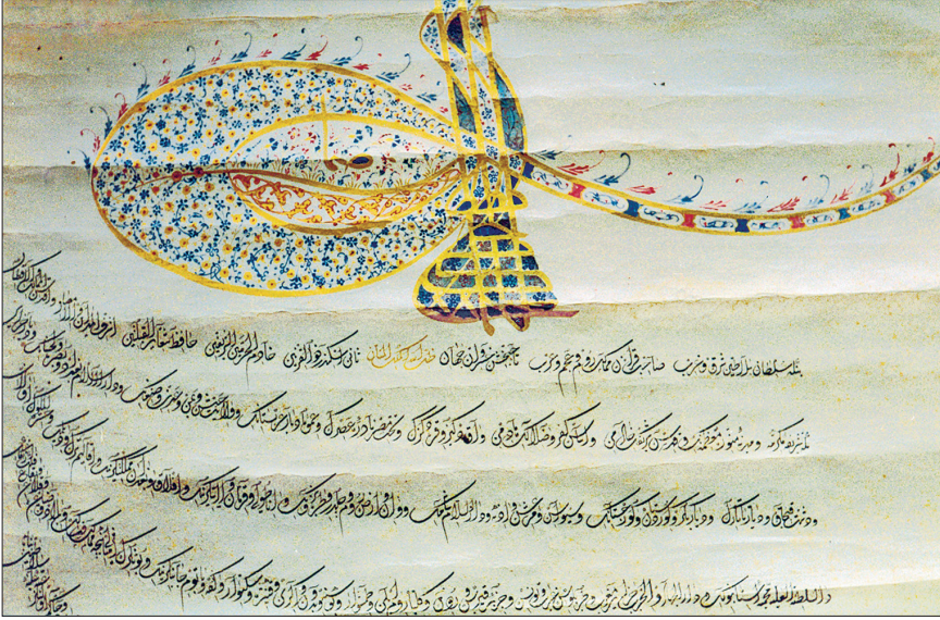
Erdel hâkimine verilen 1608 tarihli ahidnâme-i hümayun (ÖNB, Handschriftensammlung Mixt, nr. 1598)

tuğu ülkelerle bir tür vasallık ilişkisi içinde bulunduğunu söylemek mümkündür.