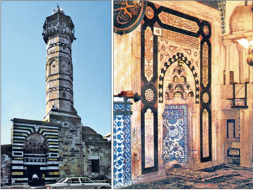
Adana Ulucamii'nin minaresi ve taçkapsı ile mihrabı

kaplı soğanvari bir kubbeyle diğer yerler çapraz tonozlarla örtülmüştür. Harimin batısında Ramazanoğulları beylerinin namaz kılmasına mahsus olduğu tahmin edilen, caminin bünyesine dahil bir bölümle doğusunda içinde üç sanduka bulunan, mihrabın önündeki kubbenin tam bir benzeriyle örtülü türbe yer almaktadır. Sandukalar ve bu üç mekân duvarları 1,30 m. seviyesine kadar XVI, XVII. yüzyıl çinileriyle kaplanmıştır. Mihrap, çinilerden başka minberle birlikte Zengî ve Memlûk geleceğini aksettiren renkli taş kakmalarla ayrıca tezayin edilmiştir.