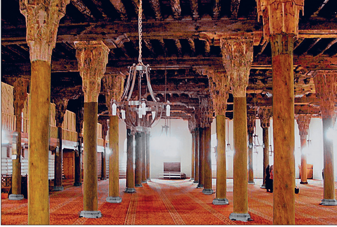
Afyon Ulucami'i'nin içinden bir görünüşü