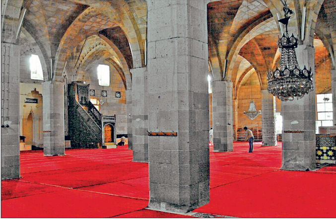
Aksaray Ulucamii'nin harim kısmından bir görünüşü

taçkapı dikdörtgen formlu ve cepheden taşkın biçimde ele alınmıştır. Mukarnaslı kavsaraya sahip, sivri kemerli girişin iki yanında birer niş görülmektedir. Cephenin iki yanında pilastırlarla iki katlı düzenleme oluşturulmuştur. Bu düzenlemelerden altta yer alanında mukarnaslı bir niş ve bunun üzerinde yatay yerleştirilmiş boş bir kartuş bulunmaktadır. Bu düzenlemenin üzerinde dilimli, kör bir kemer ve iki yanında birer rozet motifli mevcuttur. Üstte yer alan ikinci alanda ise şemse formunda bitkisel bezeme görülmektedir. Cephe düzenlemesi üstte profilli bir kornişle sınırlandırılmış olup taçkapının üstü içi bitkisel bezemeli üçgen alınlıkla sonlanmaktadır.