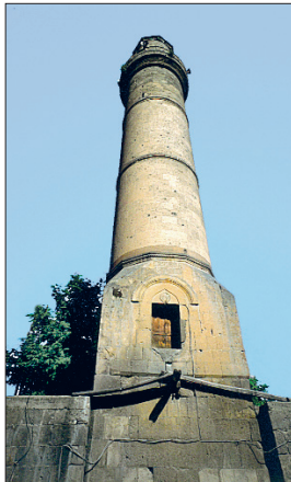
Bitlis Ulucamii'nin minaresi

Caminin ceviz ağacından künde-kârî minberi bir sanat şaheseridir. Ustası el-Hâc Muhammed b. Abdülazîz İbnü'd-Dakkî'dir. Minberin ilginç özelliklerinden biri de Kur'ân-ı Kerîm'deki âyet sayısına tekabül eden 6666 adet parçadan meydana gelmesidir. Bundan daha da önemlisi minberin mihraba bakan doğu yüzünde güneş sisteminin yani güneş ile gezegenlerinin, batı yüzünde ise galaksi sisteminin tasvir edilmiş olmasıdır. Mihraptaki süslemeler 1862 yılında Bursa'ya sürgün edi-