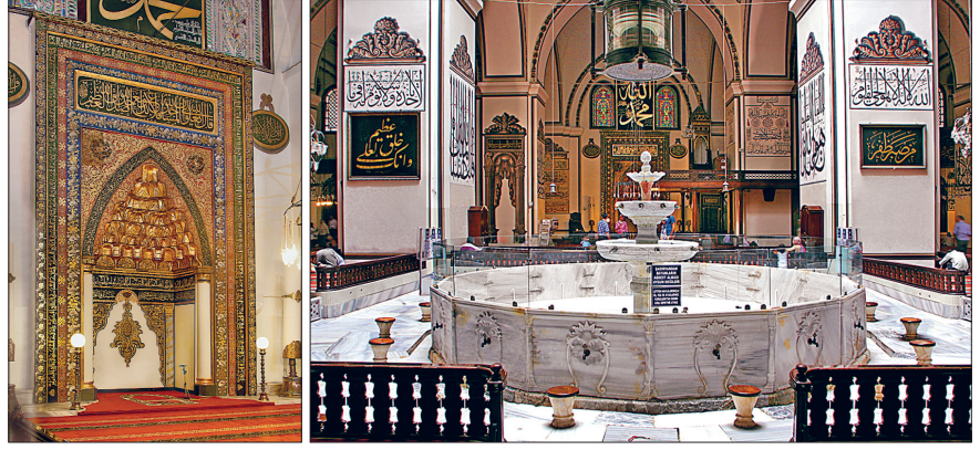
Bursa Ulucami'nin mihrabı ve içinden bir görünüş

İki minareden batıdakini Yıldırım Bayezid'in yaptırdığı, doğudaki ikincisinin de ilk yapıda planlandığı halde yarım kaldığı, bir müddet bu şekilde kullanılarak adına "güçük minare" denildiği ve daha sonra Çelebi Sultan Mehmed ya da Yavuz Sultan Selim devrinde tamamlandığı tahmin edilmektedir. Minarelerin kaideleri ve küpleri