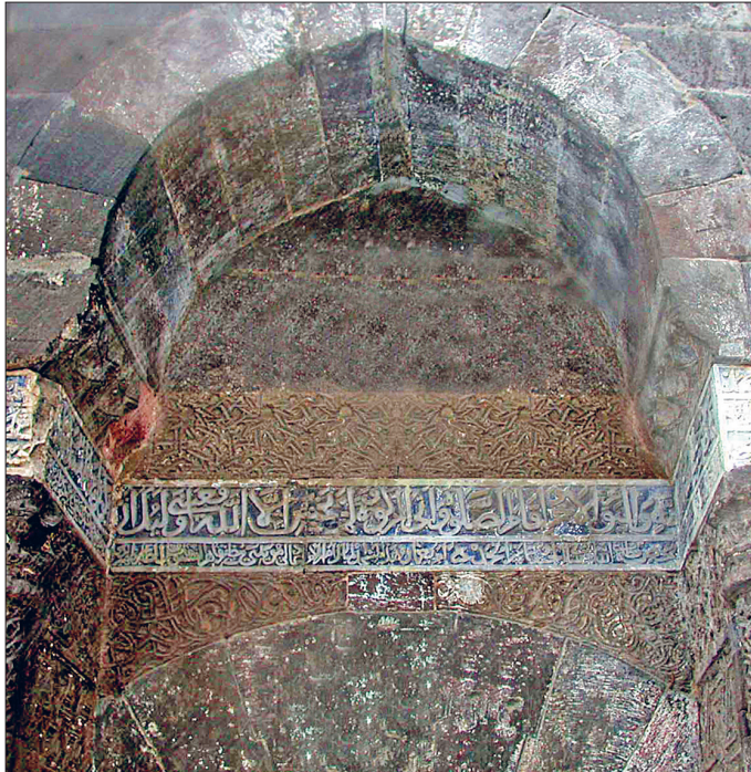
Bünyan Ulucamii'nin taçkapısı üzerindeki kitâbe

Cizre Ulucamii. Günümüze kadar birçok onarım geçirerek ulaşan yapı bazı araştırmacılara göre İslâmiyet'in Anadolu'ya ilk girdiği yıllarda, muhtemelen VII. yüzyılda kiliseden camiye dönüştürülmüştür. Abbâsiler döneminde tamir edilen cami, 555 (1160) yıllarında Zengî Atabegi Ebül-Kâsım Mahmud Sencer Şah tarafından ye-