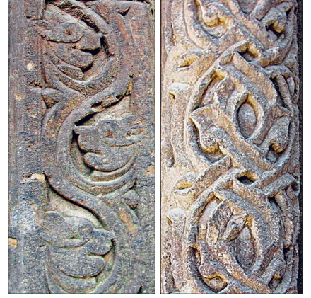
Bünyan Ulucamii taçkapısından taş süsleme detayları

Cami mihraba dik üç nefli olup orta nef daha geniş ele alınarak mihrap aksı vurgulanmıştır. Yapının ahşap kirişlemeli üst örtüsü birbirine sivri kemerlerle bağlanan, ortada serbest dört, kuzey ve güney duvarlarında yarım ikişer pâyeye taşınmaktadır. Kuzey duvarı içinden üst örtüye çıkışı sağlayan merdiven bulunmaktadır. Duvarları sıvanmış yapıda tek süsleme mihrapta görülmektedir. Kesme taş mihrap beş kenarlı nişli ve mukarnaslıdır. Nişin iki yanı sütunçelerle yumuşatılmıştır. Sivri kemerin köşe dolgularında birer kabartma rozet yer almaktadır. Günümüzde yenilenmiş olan mihrapta geometrik geçmelerden meydana gelen süslemelerin bulunduğu bilinmektedir. Caminin minberi de mihrap gibi kesme taştan yapılmıştır. Yan aynalıkları bezemesiz bırakılan minberin dilimli kemerli kürsü kısmı üstte prizmatik bir külâhla sonlanmaktadır. Caminin kuzeybatısındaki minare XX. yüzyılda yenilenmiştir. Cephe yüksekliğinde ele alınmış kare planlı kaidenin köşeleri