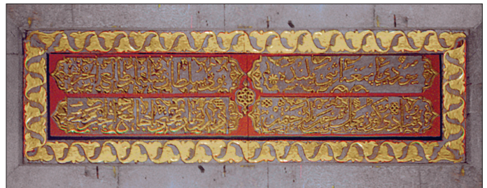
Çankırı Ulucamii'nin kitâbesi

Harim mekânı merkezde bağdâdî kub- be, diğer kısımlarda ahşap çubuk taksi-