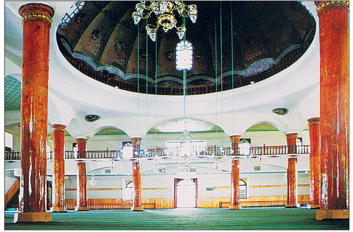
Çorum Ulu Camii'nin harim kısmından bir görünüş

rev aldığı anlaşılmaktadır. Harimin güneydoğu ve güneybatı köşelerinde yerden yüksek, ahşap kare gövdeli ve kubbeli birer sakal-ı şerif mahfazası mevcuttur. Caminin çifte minaresi son cemaat yeriyile harim mekânının birleştiği köşelerde yer almaktadır. Benzer özellikler gösteren minarelerden kuzeydoğu yönündeki 1911 anarımında yapılmıştır. Daha önce burada harime açılan bir odanın varlığı bilinmektedir. Yüksek bir kaide üzerine oturan armudî formlu pabuçluğa sahip her iki minare onaltıgen gövdeli ve tek şerefelidir. Şerefe korkuluğu yekpâre kesme taş, şerefe altı iç ve dışbükey silmelidir. Kurşun kaplı külâhın altında bir dizi firûze çini sıralanmıştır.