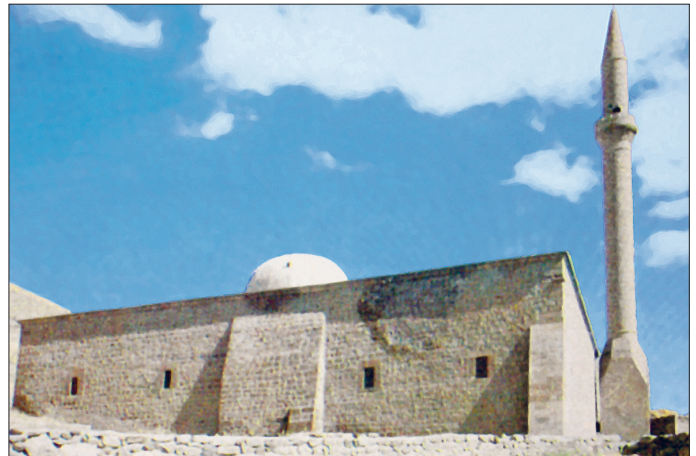
Yukarı Develi Ulucamii – Kayseri

Caminin iki minaresi mevcuttur. Bunlardan taçkapı üzerinde yer alan köşk tipi minare özgündür ve minareye taçkapının solunda cepheye bitişik otuz üç basamaklı bir merdivenle ulaşılmaktadır. Diğer minare yapının kuzeybatı köşesinde yer almaktadır ve yakın zamanda kesme taştan inşa edilmiştir. Kare kaide üzerinde silindirik gövdeli tek şerefeli minarenin üstü külâh-