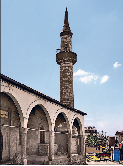
Aşağı Develi Ulucamii – Kayseri

tıda beşer, güney cephesinde dört pencere açıklığı bulunmaktadır. Dikdörtgen planlı harimin mihraba paralel neflerinde ikişerden dört sıra, toplam sekiz sütunu serbesttir, doğu ve batı cephelerinde dörderden sekiz sütunu ise duvara gömüldür. Sütunlar doğu-batı doğrultusunda atılmış üç kemerle birbirine bağlanarak mekânı beş nefe böler. Kuzeydeki nef kadınlar mahfilî şeklinde düzenlenmiştir. Ahşap kafesle çevrili mahfil ortada öne doğru çıkma yapar. Yapının üst örtüsü ahşap kirişler üzerinde düz damlıdır. Mukarnaslı taş mihrap ahşap çerçeve içine alınmış olup tepelik kısmı dikdörtgen bir levha ile taçlandırılmıştır. Mukarnasların altında nesih hatla esmâ-i hüsnâdan isimler yazılıdır. Bitkisel ve geometrik süslemeli bordürlerle çevrelenen mihrapta sivri bir kemer altında yer alan mukarnasların içleri ve köşelikler yoğun biçimde dolgulanmıştır. Ahşap minberin bir sanat değeri yoktur. Minberin yanında batı duvarına asılı dikdörtgen çerçeve içinde geyik derisi üzerine sülüs hatla sekiz satır halinde yazılmış bir levha görülür. Seyrânî tarafından söylenen tarihçede yapının geçirdiği onarımlar anlatılmıştır.