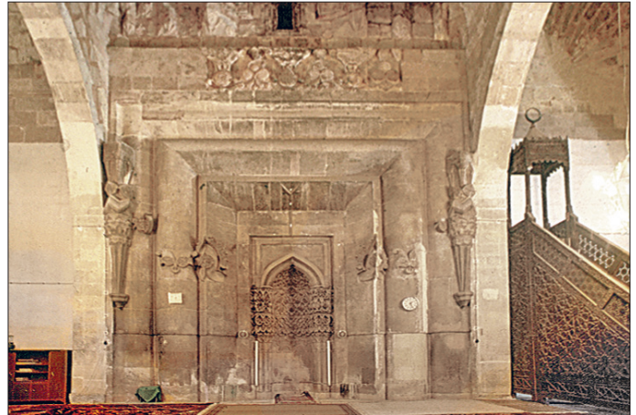
Divriği Ulucamii'nin mihrap ve minberi

Kesme taş malzemeyle inşa edilen camii enine dikdörtgen planlıdır. Önünde büyük revaklı bir avlu bulunan yapıda harim mihraba paralel üç neflidir; nefler mihrap ekseninde neflerden daha yüksek ve geniş ele alınan bir transept ile dikine kesilmiştir. Her iki tarafta nefler kare kesitli pâyelere oturan beşer sivri kemerle bölümlenmiştir. Kemerlerin üzerinde daha küçük ikinci bir sıra kemer dizisi vardır. Neflerin ve transeptin üzeri içten ahşap tavanlı olup dışta iki tarafa meyilli ahşap çatılarla örtülmüştür. Yapı plan kuruluşu bakımından Şam Ermeviyye Camii ile ya-