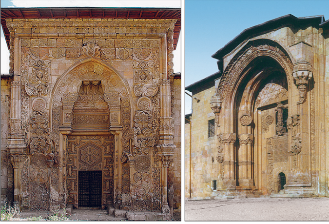
Divriği Ulucamii'nin kuzey cephesindeki taçkapısı ile Divriği Dârüşşifası'nın taçkapısı