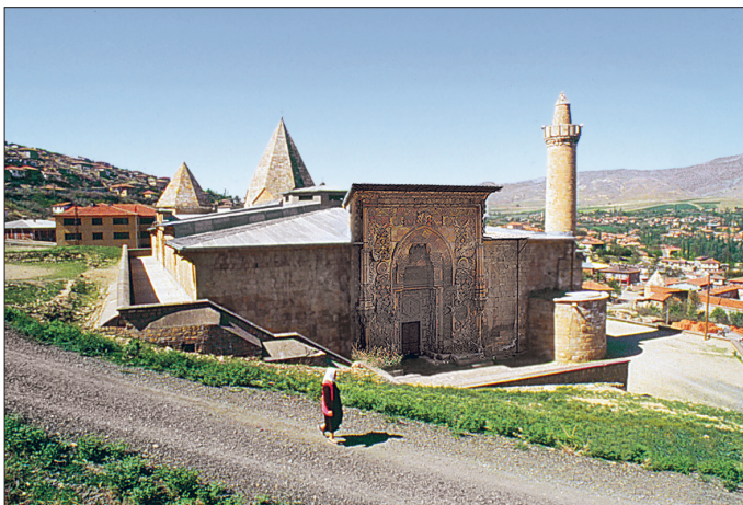
Divriği Ulucamii ve Şifâhânesi - Sivas

Caminin güneyinde yapıya bitişik durumdaki dârüşşifâ, kapısı üzerindeki kitâbeye göre Turan Melek tarafından inşa ettiril-