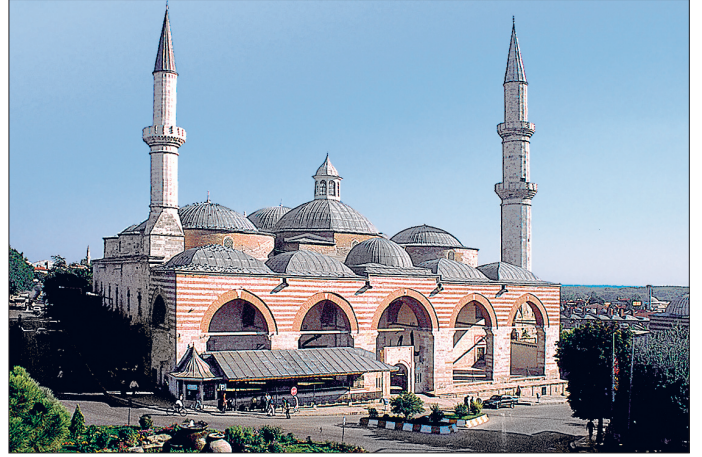
Edirne Ulucamii (Eskicami)

ları mahalline bitişik bir konumda yer almaktadır. Üç cepheli yapının dış cephesinde Nakkaşzâde Mehmed'e ait 1195 (1781) tarihli celi sülüs bir âyet kitâbesi mevcuttur. Caminin yanında 1826 yılında bir muvakkithânenin yapıldığı bilinmekle beraber yol yapımı sebebiyle ortadan kalkmıştır. Eskicami Medresesi Camiardı Medresesi ve Medrese-i Atîka adıyla da anılmaktadır; ancak bugüne ulaşmadığından mimarisi bilinmemektedir.