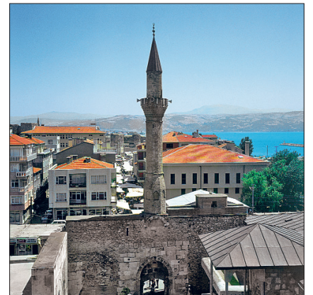
Eğridir Ulucamii (Hızır Bey Camii)

tadır. Caminin ilk yapım tarihini ve bânisini açıklayan bir kitâbesi yoktur. Ancak Hamidoğulları'ndan Dündar Bey zamanında yapıldığı bilinen Taşmedrese ile (701/1301-1302) aynı dönemde inşa edilmiş bir yapı olmasının yanında Hamidoğulları'nın üçüncü emiri olan ve ilk idaresi 1327-1328 yıllarında gerçekleşen Hızır Bey tarafından inşa ettirildiği de öne sürülmektedir. Bu sebeple Hızır Bey Camii diye de bilinen cami genellikle XIV. yüzyılın ilk çeyreğine tarihlendirilmektedir. Yapı 1815'te yangın geçirmiş, 1820'de Eğridir mütesellimi Yılanlıoğlu Şeyh Ali Ağa tarafından yeniden yaptırılmıştır. Caminin harimi 1819'da tekrar inşa edilirken kuzeye bakan taçkapının önüne dört ahşap direğe oturan konsollu ve ahşap tavanlı bir giriş saçağı eklenmiş, 1878'deki onarımda çatısı, batıdaki kapısı, pencereleri, mihrap ve minberi yeniden yapılmıştır. Eğridir âyanından Burhanzâde Hacı Murad Ağa 1884'te bir onarım daha gerçekleştirmiştir. Vakıf-