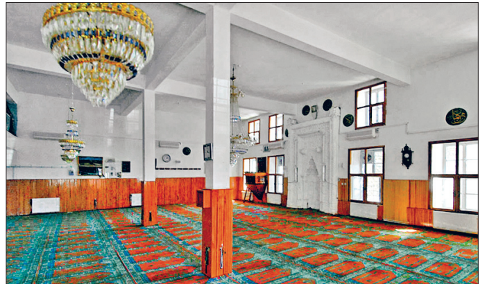
Ermenek Ulucamii'nin harim kısmından bir görünüş

Harim mihraba paralel üç neflidir ve kesme taş örgülü kare kesitli pâyelere oturan yedişer sivri kemerle bölümlenmiştir. Kuzeyde yer alan nefin üzerinde fevkanî bir ahşap mahfil mevcuttur. Mahfilin barok süsleme özellikleri XIX. yüzyıl başlarında yenilenmiş ya da yeniden yapılmış olduğunu düşündürmektedir. Mihrap alçı ve çini süslemeleriyle dikkati çekmektedir. Mihrabın dış çerçevesinde firûze renkli kare ve dikdörtgen çini parçaları ve alçı ile geometrik bir süsleme, ikinci bordürde kartuşlar içinde firûze renkli çini zemin üzerinde alçıdan küfi hatlı âyetler bulunmaktadır. Mukarnaslı kavsaralı mihrabın kemer köşeliklerinde firûze çini üzerine alçı ile yıldız geçmeler yapılmıştır. Üstte alçıya gömülmüş koyu mavi renkte iki altıgen levha ile iki Milet işi tabak mevcuttur. Kesme taş örgülü minberin köşk kısmının altında dikdörtgen, basamaklarının altında ise kaş kemerli bir açıklık vardır. Bitkisel süslemelerin yer aldığı minberde kalem işiyle yaprak ve lâle motifleri, ayrıca ahşap mahfilde kalem işi süslemeler görülür. Caminin son cemaat yeri önünde sonradan yapılmış bir ahşap minare bulunmaktadır.