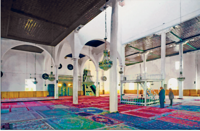
Eğirdir Ulucamii'nin harim kısmından bir görünüşü

lar'ın yaptığı son onarımda harimin üzeri kurşun kaplı kırma çatıyla örtülmüştür.