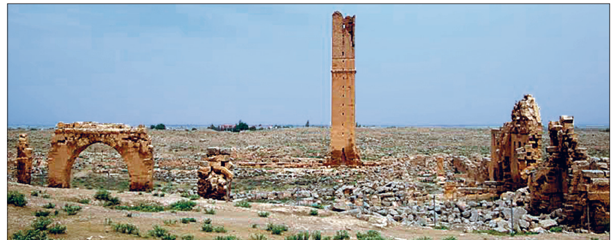
Harpan Ulu camii'nin kalıntıları

Hasankeyf Ulu camii. Hasankeyf Kalesi'nin kuzeybatısında çevreye hâkim bir tepe üzerindedir. Birkaç kitâbesi bulunmasına rağmen ne zaman yapıldığı kesin olarak bilinmemektedir. 724 (1324) ve 907 (1501-1502) yıllarında Eyyübîler ve Akkoyunlular tarafından tamir edilip genişletilmiştir. Aynı özellikteki yapılarla karşılaştırılarak XII. yüzyılda Artuklular döneminde inşa edildiği söylenebilir. Yapı bir hayli değişiklik geçirmiş olup bugün terk edilmiş durumdadır. Cami yamuk planlı bir