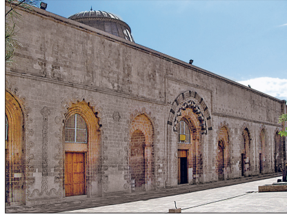
Kızıltepe Ulucamii'nin ön cephesi

Harim mekânı, taş örgülü iki pâyedizi ve sivri kemerlerle mihraba paralel üç nefe ayrılmış, üzeri beşik tonozla örtülmüştür. Mihrap önünde iki nefi kesen yüksek kasnaklı oval bir kubbe yer almaktadır. Üç dilimli ve mukarnas dolgulu, değişik süslemelere sahip, sivri kemerli trompların üzerinde kubbe geçişini onaltıgene tamamlayan yine mukarnas dizili köşe elemanları mevcuttur. Kubbe eteğinde bir dizi, kasnakta ise dört pencere açılmıştır. Büyük bölümü yıkılan kubbe ve tonozlar restorasyonda tamamlanmıştır. Zengin süslemeli taş mihrabın etrafı tromplara kadar yükselen kaval silmelerle çevrilip kademeli kuşaklarla sarılmıştır. Benzeri olmayan bu çok ünlü mihrap nişe doğru dalaran iki kademeli sütunçeli ve kemerlerle