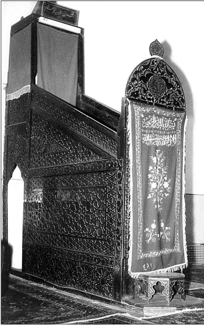
Küre Ulucamii'nin minberi

açıklıklı birer pencere görülür. Son cemaat yerindeki ahşap korkuluklar ilk yapımdan kalmıştır.