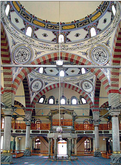
Kütahya Ulucamii'nin harim kısmından bir görünüş

Malatya Ulucamii. Eski Malatya şehri merkezinde (bugün Battalgazi ilçesi) yer alan cami Anadolu Selçuklu Sultanı I. Alâeddin Keykubad tarafından 621'de (1224) yaptırılmıştır. Yapımından kısa bir süre sonra başlayan tamir ve müdahaleler sonucu caminin planı ve mimarisinde değişiklikler meydana gelmiştir. 645 (1247) ve 672 (1273-74) yıllarında yapıya esaslı müdahalelerde bulunulmuş ve kuzeyine bir bölüm eklenmiştir. XIV. yüzyılın sonu ile XV. yüzyılın başlarında cami çevresinde "kaysâriye" denilen bir çarşının inşa edildiği anlaşılmaktadır. 1902'de tekrar onarım gören yapı uzun süre bakımsız ve harap durumda kalmış, son olarak 1960'lı ve 1980'li yıllarda tamir edilmiştir.