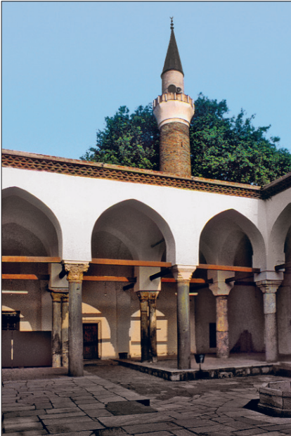
Manisa Ulucamii'nin avlusundan bir görünüşü

Cami doğu-batı doğrultusunda gelişen, dikdörtgen planlı, eşit büyüklükte bir harim ve bir avludan meydana gelir. Duvarlarda bol miktarda devşirme taşın yanı sıra moloz taş ve tuğla kullanılmıştır. Avlunun kuzey duvarının ekseninde taçkapı yer alır. Taçkapının üzerindeki yarım kubbenin içi yivlerle dolgulanmış, çevresi renkli taş kakmalı bir kemerle kuşatılmıştır. Yanlarda bulunan sivri kemerli nişlerin üzerinde, kırmızı renkli taşlar ve firûze renkli çini parçalarıyla kakma olarak yapılmış örgülü yuvarlak birer madalyon vardır. Ayrıca ortada firûze sırlı ve yivli bir çini kabara bulunmaktadır. Bütün bu süsleme öğelerine rağmen söz konusu taçkapıda