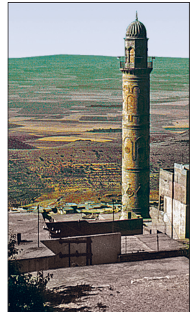
Mardin Ulucamii'nin minaresi