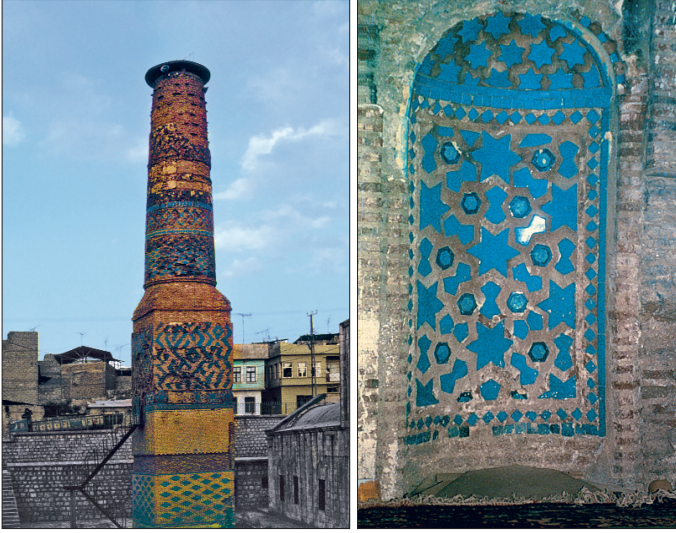
Siirt Ulucami'nin minaresiyle doğudaki mihrabı

muş, kalın ayaklarla desteklenen tromp geçişli kubbeler sekizgen kasnak üzerine oturtulmuştur. Yeni yapıda pencere açıklıklarını çeviren sivri kemerlerle geometrik şekilli alçı şebekelerden başka süslemeye yer verilmemiştir. Kible duvarındaki alçı mihraplar 1962'de inşa edilmiş olup önlerindeki yuvarlak sütunçe ve kemerleriyle yarım daire planlı nişlerden meydana gelmektedir. Ancak eyvanın iki yanında kubbeleri taşıyan orta ayaklardaki tâli mihraplar ilk yapıdan kalmadır. Restorasyon sırasında ortaya çıkarılan bu mihraplar süslemeleriyle birlikte günümüze ulaşmıştır. Aynı özelliği taşıyan mihrapların niş ve kavsaralarına kırmızı tuğla zemin üzerine yerleştirilmiş firûze ve lâcivert renkli çinilerden yıldız örnekli geometrik şekiller işlenmiştir. Dış çerçevedeki palmetler ve kûfî yazı kuşağı dökülmüştür. Asıl mihrapların da benzer kompozisyonlu mozaik çinilerle süslendiği sanılmaktadır. Caminin, Ankara Etnografya Müzesi'nde sergilenen ceviz ağacından şahane minberi 611 (1214-15) tarihiyle sekiz sanatçı ve mütevellî adı taşıyan tek örnek durumundadır. Gerçek künde-kârî tekniğiyle yapılan minberde beşgen ve beş köşeli yıldız çerçevesi bitki süslemeleri hâkimdir.