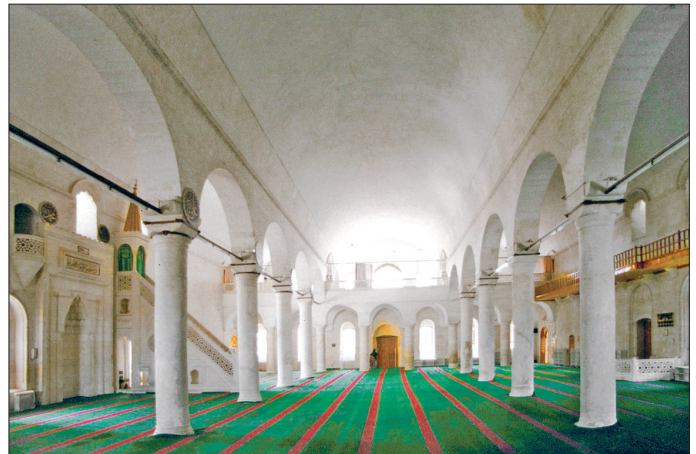
Urfa Ulucamii'nin harim kısmından bir görünüş

Moloz taşla inşa edilen yapı bugün kare bir alana oturmakta olup mihrap önünde büyükçe bir kubbe, bunun önünde tonozlu bir birim ve iki yanda üçer kubbeden meydana gelen bir üst örtüye sahiptir. Üst