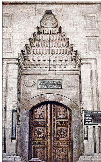
Zile Ulucamii'nin taçkapısı

açılmıştır. Son cemaat yerindeki taçkapı dışında iki yanda yer alan yuvarlak kemerli kapıların üstleri yarım kubbe ile örtülü ahşap saçaklarla zenginleştirilmiştir. Harimde merkezî kubbeyi kuzey yönünde taşıyan iki serbest pâyeye kare kesitli olup köşeleri ve altlı üstlü çevresi kaval silmelerle yumuşatılmıştır. Kesme taş malzemeye yapılan mihrap üç yönde kıvrık dallı, bitkisel süslemeli geniş bir bordürle sınırlanmıştır. Nişin iki yanında ikişer burmalı sütunçe yer almaktadır; bunların başlıkları bir konsolla birleştirilerek üstlerine birer ışınal düzenleme işlenmiştir. Geometrik kompozisyonlu geniş bir bordür içinde iki yanı rozetli mihrap âyeti bulunmaktadır. Mukarnaslı mihrap nişi alta kaş kemerli sathî nişlerle yedi kenarlı olarak yapılmıştır. Geç dönem özelliklerini yansıtan kesme taştan minber oldukça sadedir. Kaş kemerli kapı açıklığı üzerindeki alınlıkta kabark iri bir çiçek, yan aynaların ortasında birer kabara, alt kısımlarda kabark çiçek, çarkıfelek motifleriyle alternatif biçimde yerleştirilmiş dilimli kemerli ve ajurlu açıklıklarla sathî nişler işlenmiştir. Geçiş açıklığı dilimli kemerli olup yuvarlak kemerli açıklıklı köşk kısmı piramit bir külâhla örtülmüştür. Caminin yenilenen minaresi de eklektik tarzdadır ve hafif içbükey yüzeylere sahip onaltıgen şeklinde düzenlenmiştir. Bu çokgen düzenleme şerefede ve petek kısmında aynen devam ettirilmiş ve alemlî armudî bir kubbecikle sonlandırılmıştır.