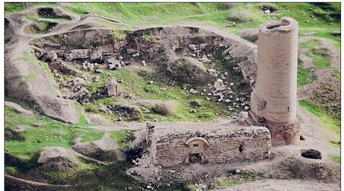
Van Ulucamii'nin kalıntıları