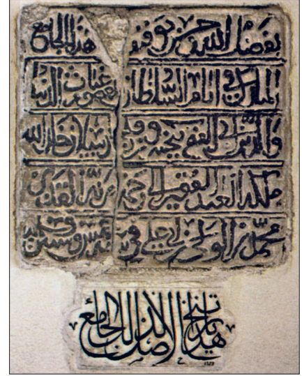
Zile Ulucamii'nin tamir kitâbesi

Eklektik etkiler taşıyan dış cephede, dolanan konsol dizili saçakta ve alt pencereleri çevreleyen kaş kemerli çökertme çerçeveler dışında süsleme bulunmamaktadır. Üst sırada yuvarlak kemerli üçlü pencerelere sahip yapıda yüksek kasağın her yüzünde yuvarlak kemerli ikişer pencere