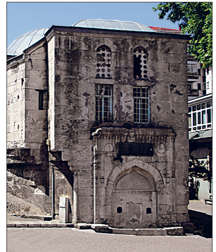
Yâkub Ağa Sıbyan Mektebi ve Çeşmesi – Üsküdar / İstanbul

Üsküdar'ın tarihî müslüman mezarlığı 75 hektarlık bir alanı kaplayan Karacaahmet Mezarlığı'dır. Fetih'ten önce Türkler'in denetimi altında bulunduğu yıllardan itibaren (XIV. yüzyıl) ortaya çıkan kabristan İstanbul'un ele geçirilmesinden sonra şehrin Anadolu yakasında kesintisiz biçimde kullanılmıştır. Bu mezarlık sanatsal değerleri yüksek, Türk hat sanatı açısından son derece değerli mezar taşlarını bünyesinde saklayan bir müze gibidir. Bülbül-