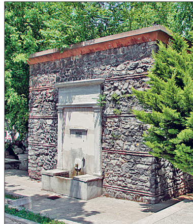
Sultan II. Mahmud Çeşmesi ile Seyh Devâtî Camii avlu duvarına bitişik kitâbesiz çeşme

Üsküdar'da Rum Mehmed Paşa, Mihrimah Sultan, Atik Vâlide, Çinili ve Selimiye külliyelerinin hamamları dışında mevcut durumdaki en eski hamam Rum Mehmed Paşa Camii yakınındaki çift hamamdır. Kare planlı, şirvanlı soyunmalı, enlemesine dikdörtgen planlı ılıklı, ortasında sekizgen göbek taşı olan, dört köşesi halvetli ve üzeri kubbe örtülü sıcaklığı ile klasik Osmanlı hamamlarının karakteristik plan şemasına sahiptir. Ahmediye'deki Ağa Hamamı, Malatyalı İsmâil Ağa tarafından 1018 (1609) yılında yaptırılmıştır. Çift katlı soyunmalı, sekizgen biçimli yüksek aydınlık feneri vardır. Küçük bir ılıklıkla sekizgen göbek taşı (sadece erkekler kısmında) ve dört köşesinde üzeri kubbeciklerle örtülü halvetleri bulunan klasik bir ör-