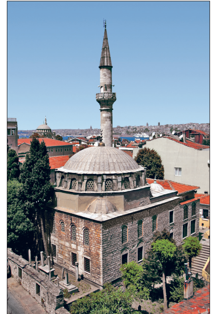
Kaptanıderyâ Kaymak Mustafa Paşa'nın inşa ettirdiği Kaptan Paşa Camii

iç kesimlerde yeni mahalleler kurularak buraları vakıf eserlerle donatılmıştır. Fethin ardından Veziriazam Rum Mehmed Paşa'nın inşa ettirdiği külliye, Mihrimah Sultan, Şemsi Paşa, Atik Vâlide Sultan, Çini Camii, Yeni Vâlide, Ahmediye, Ayazma, Altunizade külliyesi izlemiştir. Üsküdar'ın kubbeli camileri içinde Sadrazam Kara Nişancı Dâvud Paşa'nın yaptırdığı camii dışında kare planlı, üzeri bir kubbeyle örtülü yapılardan Kaptanıderyâ Kaymak Mustafa Paşa'nın eski bir mescidin yerine inşa ettirdiği 1140 (1727-28) tarihli camii ile II. Mahmud'un hareminden Cevri Kalfa adına XIX. yüzyıl başlarında Zeynekâmil'de yaptırılan empire üslûbündeki camii önemli örneklerdendir. Üzerleri birer kırma çatıyla örtülü, daha küçük ölçülerde ve mimari özellikleri yönünden daha mütevazı camilerden Gülfem Hatun Camii inşa edilirken mimari özelliklerini büyük ölçüde yitirmiştir. Harem'deki 1242 (1826-27) tarihli Tâhir Efendi Camii empire üslûbunda inşa edilmiştir. Selman Ağa Camii (912/1506), Doğanclar'daki Çakırcıbaşı Hasan Paşa Camii, Ayazma'da 1006 (1597) tarihli İmrahor Camii, Salacak'ta Sinan Paşa Camii, Sultantepe'de Şeyhülislam Mirzazâde Şeyh Mehmed Efendi'nin 1143 (1730-31) tarihli camii Üsküdar'daki çatılı camilerin belli başlı diğer örnekleridir. Men-