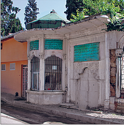
Karacaahmet'teki Kadı Sâdeddin Efendi Sebili – Üsküdar / İstanbul

nektir. Nurbânû Sultan'ın Atik Vâlide Sultan Külliyesi'ne akar olarak inşa ettirdiği çifte hamam Üsküdar'daki en önemli hamamdır. Çarşı Hamamı adıyla tanınan bu yapı Mimar Sinan'ın eseridir. Kadınlara ve erkeklere ait bölümlerin planları birbirinin aynıdır ve tam bir simetri hâkimdir. Büyük değişikliklerle çarşıya dönüştürülen hamamın ortadan kalkan soyunmalık kısımları kare planlı geniş birer mekân halinde olmalıdır. Üzeri üçer kubbecikle örtülü enlemesine mekânlardan ibaret ılıkılık ve yıldızvari planlı sıcaklıklara sahiptir. Günümüzde aslı işlevini sürdüren hamamlardan İcadiye Dağ Hamamı, Şeyhülislâm Ârif Hikmet Bey'in Medine'deki kütüphanesine akar olarak yapılmıştır. Ortasında aydınlık feneri bulunan, dört yöne eğimli bir çatıyla örtülü soyunmalık, dar bir mekân halindeki ılıkılık, kubbe örtülü, ortasında göbek taşı olan, iki halvetli sıcaklıktan meydana gelir. Ayazma Sarayı'nın hamamı ile Selâmsız'daki Kuşluk Hamamı günümüze harap durumda ulaşmış, Cinci Hüseyin Efendi, Sinan Paşa ve Hüseyin Paşa hamamları ortadan kalkmıştır.