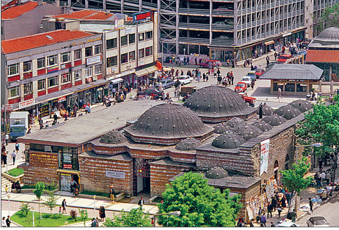
Nurbânû Sultan tarafından yaptırılan Çarşı Hamamı – Üsküdar / İstanbul