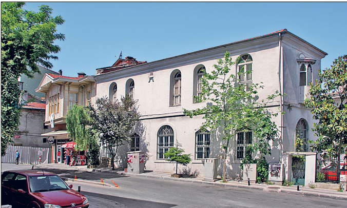
Üsküdar Mevlevîhanesi'nin semâhâne- türbe binası