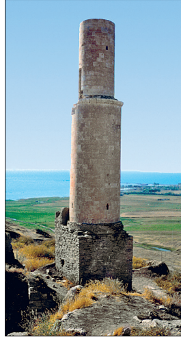
Van İckale (Süleyman Han) Cami'i'nin minaresi

Van Kalesi, Van ovasının ortasında yükselen yalçın kayalığın üzerindeki iç kale