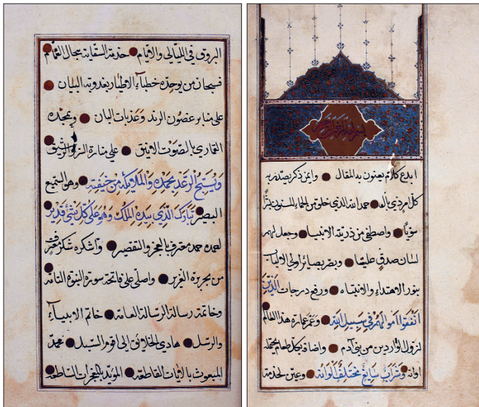
Fâth Sultan Mehmed vakfiyesinin ilk iki sayfası (VGMA, Vakfiye, nr. 18)

İlhanlı Hükümdarı Gâzân Han’ın İslâmiyet’i kabulünden sonra Tebriz yakınlarında yaptırdığı türbe ile diğer hayır kurumlarına ilişkin 1 Rebülevvel 709 (9 Ağustos 1309) tarihli vakfiye bu döneme ait en hacimli vakfiyedir; Cemâziyelâhîr 710’da (Kasım 1310) Tebriz Kadısı Mecdüddin Abdullâh b. Ömer ve 15 Şevval 710’da (7 Mart 1311) Kâdikudât Ebû’z-Zafer b. Hasan tarafından tescil edilmiştir. Bu tarihten itibaren 809 (1406) yılına kadar vuku bulan dava veya teftişler neticesinde dönemin Hanefî ve Şâfiî kadılarınca düşülen tescil tevkîi kayıtlarının ikisi Farsça, diğerleri Arapça’dır ( Vakfnâme-i Rab’-i Reşîdî , s. 23-34). Gâzân Han bu vakıflara şer’an kendi mülkü olan toprak ve emlak vakfetmiş, vakfının sıhhatine dair birçok âlim ve müftüden fetva almış, vakfiyesini yedi nüsha halinde tanzim ve tescil ettirmiştir. Timurlular devrine ait Ali Şîr Nevâî’nin Çağatayca vakfiyesinin İsmail Hikmet Ertaylan tarafından neşredilen metninin tarihi ve şahitler kısmı bulunmamaktadır ( Vakfiye , s. 17-55). Eski Sovyet İlimler Akademisi Şarkiyat Enstitüsü’ndeki yazmalar bölümünde kayıtlı (nr. B. 670), Sultan Timur b. Şeybânî Han’ın zevcesi Mihr Sultan Hanım’ın vakfiyesi de geniş hacmiyle (107 varak) dikkat çekmektedir. Bu vakfiyenin hattına bakarak orijinal metin veya ondan istinsah edilmiş nüsha olabileceği söylenmektedir.