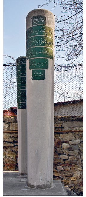
Veliyyüddin Efendi'nin mezar taşı

Veliyyüddin Efendi, Çelebizâde Âsım Efendi şeyhülislâmlığa getirildiğinde Vezîriâzam Râgıb Paşa ile birlikte huzura kabulü sırasında her ikisinin de talebiyle affedildi ve 1 Zilhicce 1172'de (26 Temmuz 1759) İstanbul'a döndü. 28 Cemâziyelâhir 1173'te (16 Şubat 1760) Çelebizâde Âsım Efendi'nin vefatı üzerine şeyhülislâmlığa tayin edildi. Bu göreve tayini esnasında hastalığından dolayı saraya gidemedi ve iyileşinceye kadar konağında oturmasına izin verildi; padişahın huzurunda giyilmesi âdet olan şeyhülislâmlık kıyafeti (ferve-i beyzâ) evine gönderildi. Kaynaklarda bu durumun meşihat tarihinde ilk defa görüldüğü kaydedilir. Veliyyüddin Efendi, sert mizacı sebebiyle bir yıl altı ay on sekiz gün süren görevinin ardından 6 Safer 1175'te (6 Eylül 1761) şeyhülislâmlıktan azledildi. Azlinden sonra hacca gitmesine izin verildi, hac mevsimi gelinceye kadar da Bursa'da ikameti istendi. Bir süre sonra affedilerek tekrar İstanbul'a döndü. 24 Zilkade 1180'de (23 Nisan 1767) azledilen Dür-