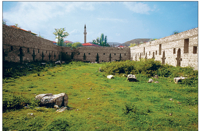
Vezir Hanı'nın içinden bir görünüşü

Sözlükte "ölçmek, tartmak; ağırlık, ağırlık ölçüsü" anlamındaki veznî kökünden nisbet ekiyle oluşturulan veznî (çoğulu veznîyyât), fıkhîta sözlük anlamına yakın şekilde çarşı ve pazarda ağırlık ölçü birimleriyle tartılan misli malı ifade eder. Literatürde veznî ile, aynı kökten türeyen ve