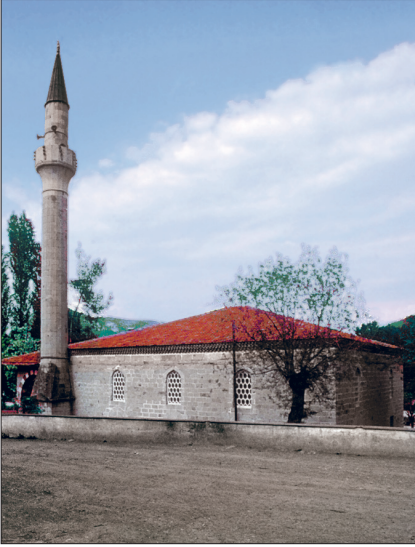
Vezirhan Köprülü Camii

ulaşmamıştır. Külliye'nin inşasından sonra bölge Vezirhan adıyla tanınmıştır. Etrafı bir avlu duvarı ile çevrili olan camiye avlunun kuzeyindeki basık kemerli bir kapı ile ulaşmaktadır. Cami kesme taş malzemeye inşa edilmiştir ve önündeki son cemaat yeriyle birlikte üzeri kiremit kaplı ahşap çatı ile örtülmüştür. Beş birimli son cemaat yerinde sol taraf iki, sağ taraf tek kemerli olarak düzenlenmiştir. Sekizgen kesitli pâ-yelere oturan sivri kemerlerden sol yanda cami beden duvarına bağlanan kemerle cephede kapı aksında yer alan orta kemer diğerlerinden daha küçük ele alınmıştır. Son cemaat yerine yuvarlak kemerle açılan harim 17,30 x 18,60 m. ebadında kareye yakın dikdörtgen planlıdır. Çift sıra pencerelere sahip olan yapıda alt sıradaki pencereler kemerli alınlıklar altında dikdörtgen açıklıklı, söveli ve lokma demir parmaklıklılıdır. Üst sıradaki pencereler ise sivri kemerli açıklıklı olup filgözü dışlıklara sahiptir. Pencereler mihrap ve son cemaat yeri duvarında ikili düzende, yan duvarlarda üçlü düzendedir. Beden duvarlarının üzeri tuğladan üç sıra kırıncı saçakla çevrelenmiştir. Harim ve son cemaat yeri ahşap tavanlıdır. Mihrap kalem işleriyle süslüdür. İki yanda alt ve üst uçları palmetle sonlanan iri burmalı sütunçe şeklinde bir bezeme ile sınırlanan mihrapta üst kısımlar bitkisel dekorlu dikdörtgen alanlarla çevrelenmiştir. En üstte bitkisel süslemeli bir tepelik yer alır. Beş kenarlı nişte kavsara dilimlere ayrılmış olup alta ortasında kandil motifi bulunan perde