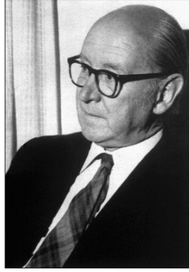
William Montgomery Watt

1937'de annesi öldükten sonra İskoç kilisesinden ayrılıp İskoç Episkopal kilisesine intisap etti. Bu değişikliğin sebebi Watt'ın o dönemde mânevî desteğe ihtiyaç duymasını, bunu da Katolikliğe yakınlığı ve âyinlerindeki geleneksel unsurların güçlü olmasından dolayı İskoç Episkopal kilisesinde bulabileceği umududur ( a.g.e. , s. 280). Bu arada aynı evde kaldığı bir müslüman arkadaşı vasıtasıyla İslâm'ı tanımaya başladı. 1938'de üniversitedeki asistanlık süresi doldu. Kalküta'da bulunan İskoç Kilisesi Koleji'nde felsefe öğretmenliğine başvuracağı sırada Kudüs'teki Anglikan piskoposunun İslâm'a entelektüel yönden yaklaşacak birini aradığını öğrenince oraya başvurdu ve başvurusu kabul edildi. Bu amaçla Oxford'daki Cuddesdon College'da hızlandırılmış bir teoloji programına katıldı; 1939 yılı güz dönemi sonlarında önce papaz yardımcısı, ardından papaz olarak tayin edildi. Şubat 1941'e kadar Londra'da, Ocak 1944'e kadar Edinburgh'ta papazlık yaptı. Bu görevi sürdürürken Arapça öğrenmeye başladı. Aynı yıl Edinburgh Üniversitesi'nde Free Will and Predestination in Early Islam başlıklı teziyle doktor unvanını aldıktan sonra Kudüs'e gitti; ardından eşi de ona katıldı; ilk çocukları Kudüs'te doğdu. 1946'da İngiltere'ye dönen Watt bir taraftan İslâmî ilimlerin öğretildiği bir yüksek okulun bulunmaması, diğer taraftan Filistin'deki İngiliz manda yönetiminin idareyi yeni kurulmakta olan İsrail'e devretmesi gibi sebeplerle tekrar Kudüs'e gitmekten vazgeçti. Edinburgh