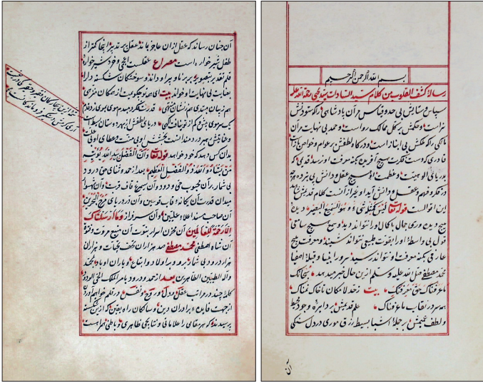
Yahyâ-yı Şirvânî'nin Farsça risâlelerinin bulunduğu mecmuanın ilk iki sayfası (Çorum Hasan Paşa Ktp., nr. 19, hk. 2101)