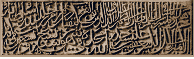
Ankara Kızılbaş Camii minberinin tamir kitâbesi