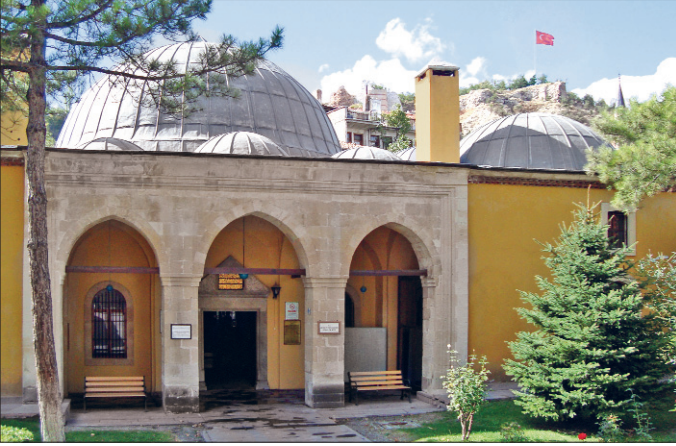
Kütahta'da Yâkub Çelebi Külliyesi

revak şeklindedir. Sivri kemerle dışarıya açılan revak yanlarda pandantifli, ortada mukarnas dolgulu üç basık kubbe ile örtülüdür. Revakın ortasındaki kapıdan geniş, kubbeli, aydınlık fenerli ve şadırvanlı bir orta mekâna geçilir. Ferah bir iç avlu konumundaki bu mekâna üç yönden kubbeli birer eyvan açılmaktadır. Dikdörtgen kuruluşlu eyvanların kubbeleri iki yana atılmış kemerlerin üzerine oturmaktadır. Girişin karşısındaki eyvanın zemini 20 cm. kadar yükseltilmiş, diğerleri düz bırakılmıştır. Yapıda yan eyvanlarla girişin iki yanında kalan boşluklara kubbeli birer oda inşa edilmiştir. Birer kapı ile orta mekâna açılan bu odaların içlerinde birer adet ocak bulunmaktadır.