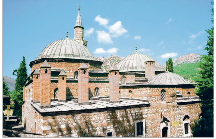
Yâkub Paşa Tekkesi – Amasya