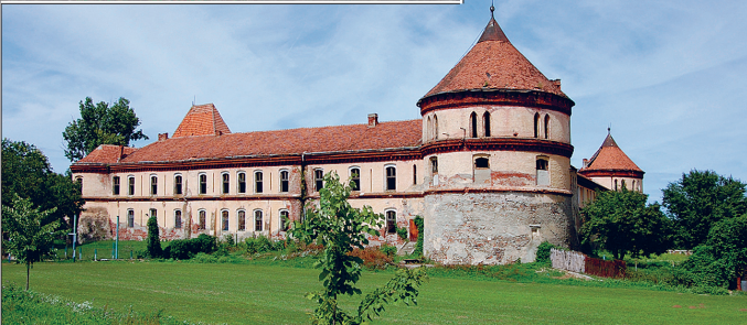
Yanova Kalesi ve kalenin içinden bir görünüş