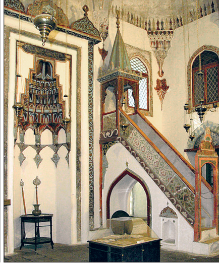
Günümüzde müze olarak kullanılan Arslan Paşa Camii ve içinden bir görünüş

rekçesiyle suçlayarak sürdürdüler. Geride çok sayıda cami harabesi ve yıkılmış köy kaldı. 1970'lerde bu bölge büyük oranda yerleşim dışıydı. II. Dünya Savaşı'nda Yanya'nın Alman işgali süresince yahudi azınlık yok edildi. 1951'de Yanya'nın nüfusu 32.315 idi. Bunların binlercesi Yanya civarındaki, 1945-1949 Yunan iç savaşında General Papagos'un ordusu tarafından yıkılan dağ köylerinin ahalisiydi.