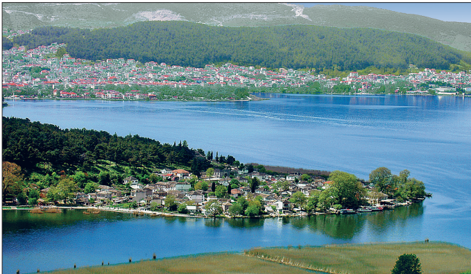
Yanya'dan bir görünüş

1669-1670'te Yanya'ya gelen Evliya Çelebi bazıları abartılı geniş bilgiler vermektedir. Ona göre şehirde pek çok âlim ve çoğu Farsça bilen bilgili kişiler vardır. Bir bölümü taştan yapılmış, aralarında pek çok sarayın da bulunduğu 4000 ev mevcuttur. Şehrin surlarla çevrili olmayan kısmında on sekiz müslüman, on dört hıristiyan, dört yahudi ve bir Çingene mahallesi bulunuyordu. Kalede iki cuma camisi ve iki mescid, açık şehirde ise hepsinin adı verilen yedi cuma camisi ve on bir mescid yer alıyordu. 1900 dükkân ve yedi de tekke vardı. İlyas Efendi Camii, XVI. yüzyılın sonunda müslüman cemaatinin arttığını gösteren, 990'da (1582) yazılmış Arapça bir kitâbeye sahipti. Müslüman cemaatinin giderek çoğaldığının bir diğer göstergesi, Zülfikar Bey tarafından 1600'den önce yeniden inşa edilen II. Bayezid (Hünkâr) Camii'dir. Bununla birlikte en büyük değişimler 1020 (1611) yılından sonra gerçekleşmiştir. Eski Yanya'nın güney varoşu olan Kalouts'a da Kanlı Çeşme Camii hâlâ ayakta. Bu cami 1730'lu yılların sonlarında yapılmıştır; kurucusu Arslanpaşazâde Ha-