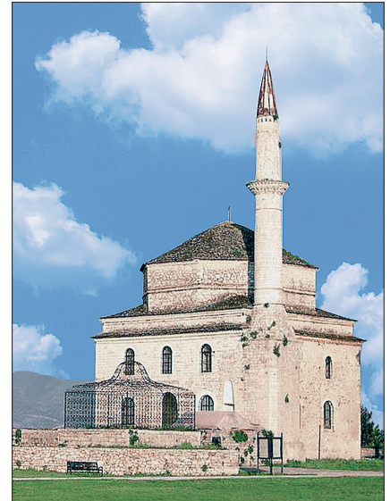
Yanya'da Fethiye Camii ve Tepedelenli Ali Paşa'nın mezarı

Yanya, 6 Mart 1913'te Esad Paşa'nın kumandası altında hemen hemen altı ay süren cesurane bir müdafadan sonra Yunan ordusu tarafından ele geçirildi ve Yunan Krallığı'nın bir parçası haline geldi. 1928'de aralarında 3000 mültecinin de bulunduğu 20.405 kişilik bir nüfusa sahipti. Yahudilerin sayısı 3000 idi. Hemen hemen bütün müslümanlar (5000 civarında) 1923 Lozan Antlaşması'nın nüfus mübadelesi neticesinde şehri terketti. 1944 Ekiminde II. Dünya Savaşı'nı takip eden sıkıntılı dönemde milliyetçi Yunan kuvvetleri, Yanya'nın kuzeybatısında yer alan Çamëria bölgesinin Arnavutça konuşan müslüman nüfusunu, savaş süresince Alman ve İtalyan ordusuyla iş birliği yaptıkları ge-