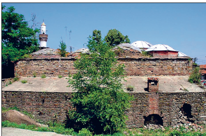
İsâ Bey Hamamı - Yenipazar

Günümüzde Novi Pazar adıyla bilinmekte olup Şumnu'nun (Şumen) 20 km. kuzeydoğusunda yer alır. Bulgarca kaynaklarda 1878'e kadar Enipazar ismiyle zikredilmektedir. Burası XVI. yüzyılda ortaya çıkmış ve Silistre sancağının Pravadi (Provadya) kazasında nahiye merkezi ve küçük bir kasaba olarak gelişme göstermiş, XVII. yüzyıldan itibaren bir kaza merkezi haline gelmiştir. Yenipazar kazasının 1873'te otuzu Türkçe, dokuzu Bulgarca ad taşıyan toplam otuz dokuz köyü vardı. Türk köylerinden bazılarında hıristiyan nüfus ağır-