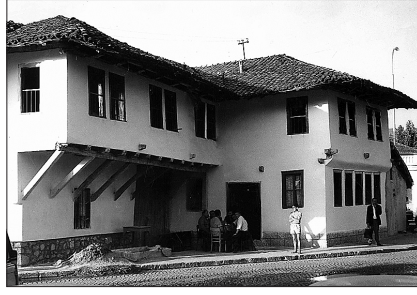
Yenipazar'da XVIII. yüzyıl sonuna ait Amir Agin Hanı

İslâm kültür eserleriyle donatılan Yenipazar'da çeşitli dönemlerde inşa edilen mimari eserlerin çoğu işgaller sırasındaki yangın (1689, 1737, 1809), sel felâketleri ve savaş tahribatı ile (1731, 1896) ortadan kalkmıştır. Zamanında otuz beşi bulunan camilerden günümüze kadar sadece on yedisi muhafaza edilmiştir. Tek kubbeli İsâ Bey Camii 1938'de yıktırılmıştır. Mevlânâ Muslihuddin tarafından yaptırılan Altun Alem Camii (1550) eski çarşının kenarında tek kubbeli olarak ayakta. 1516'da Hacı Ömer'in yaptırdığı ve Evliya Çelebi'nin kaydettiği Bor Camii savaşların birinde tahribata uğradıktan sonra restore edilmiştir (eski şeklini andıran sadece minaresi ve duvarlarının alt kısmıdır). Arap Camii (1528), XVIII. yüzyıla ait Leylek Camii ve 1836'da şehrin kenarında Mütesellim Eyüb Paşa Camii, Molla İbiş Camii ve onun karşısındaki sokakta Türk Hamamı (1489), Yenipazar'ın kuzeydoğusunda 4 km. uzaklıkta Hâfız Ahmed Paşa'nın yaptırdığı (1595) Yenipazar Kaplıcası gibi eserler günümüzde ayakta. 1450-1460 yılları arasında İsâ Bey'in inşa ettirdiği tahmin edilen, 16.000 m 2 bir alana sahip kale bugün de mevcuttur. İsâ Bey Hamamı 1970'lerde restore edilmiştir. Gaziler mezarlığı denilen ve 1683-1699 Osmanlı-Avusturya savaşının ardından bu adı alan kabristan zamanımıza ulaşmıştır. Bu arada manastır ve kiliseler de Osmanlı dönemi