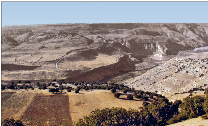
Yermük Savaşı'nın yapıldığı vadi - Ürdün

Yermük Savaşı'nın tarihi hakkında ihtilâf vardır. Bunun en önemli sebebi Taberî'nin râvilerinden Seyf b. Ömer'in savaş tarihini 13 (634) yılı olarak göstermesi, 15 (636) yılında ise Ecnâdeyn Savaşı'nın meydana geldiğini nakletmesidir. İbn