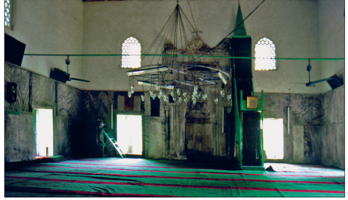
İznik Yeşilcami harim kısmından bir görünüş

sonra 794'te (1392) inşaat tamamlanmıştır. Dış kapı üzerindeki kitâbede yapının mimarının Hacı b. Mûsâ olduğu yazılıdır. Külliye günümüze ulaşmayan bir dârühadisle bir imaretin varlığı bilinmektedir. Ayrıca caminin güneydoğusunda harap durumda bugüne intikal eden bir hamam kalıntısı bulunmaktadır. XIX. yüzyılın sonlarından itibaren bakımsızlıktan harap olan cami Yunan işgali esnasında tahrip edilmiştir. Cami 1956-1960, minare ise 1961-1965 yılları arasında esaslı bir onarımdan geçirilmiştir.