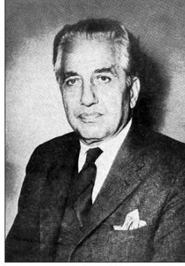
Suut Kemal Yetkin