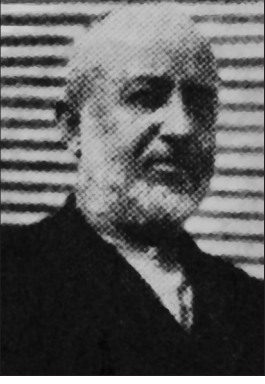
Ahmet Emri Yetkin

rettir. 7. Mecmûa-i Eş'âr-ı Emrî Yetkin . Bu defterin müellifin kendi el yazısıyla 244 sayfalık nüshası Amasya Beyazıt Kütüphanesi'ndedir. 8. Kelîmâtü'l-ekâbir . 100 İslâm büyüğünün sözleriyle bunların açıklamasını ve adı geçen kişilerin biyografisini içerir. 9. Mecmau'l-elkâb . 100 kadar lakabın açıklamasına ve lakap sahiplerinin biyografisine dairdir. 10. Hizânetü'l-cevâhir . Hz. Ali'ye ait 100 hikmetli söz ve açıklamasıdır. 11. Tuhfe-i Emrî . Muhyiddin İbnü'l-Arabî'nin münâcâtının mensur ve manzum tercümesidir.