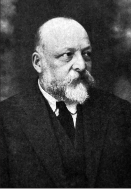
Mehmet Emin Yurdakul

likle şiiri "Güzellik için olmakla birlikte iyilik içindir de" şeklinde tarif eden Mehmet Emin, aynı yıllarda faaliyet gösteren Edebiyat-ı Cedîde şairlerinden farklı olarak sanatın gayesinin güzellik yanında millî fayda temin etmek olduğunu belirtmiştir. Onun amacı bir şair olarak şöhret kazanmak değil içinden geldiği halkın dertlerini ve acılarını dile getirmek, bunlara bir çare bulmaktır. Hayatının sonuna kadar edebiyatta halkçılık ve milliyetçilik prensibine bağlı kalan Mehmet Emin, Cumhuriyet'ten sonraki yıllarda ortaya çıkan memleketçi edebiyatın oluşmasına da ön ayak olmuştur. Eserlerinde Türkçülük, milliyetçilik, memleketçilik, halkçılık ve Cumhuriyet'ten sonraki yıllarda inkılâpçılık unsurları asıl ağırlığı teşkil eder.