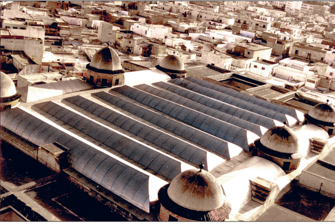
Yüsuf Sâhibü't-Tâba' Camii harim üst örtüsünün minareden görünüşü

minberde yapının inşasında çalışan İtalyan sanatçıların etkisi görülmektedir. İki sütunçe üzerindeki yuvarlak kemerli kapının üstünde iri barok stilize yapraklarla çevrelenen dış bükey kartuş yer almaktadır. İnce uzun silmelerle bölümlenen yan aynalıklar üstleri sivri kemerlerle son bulan siyah, gri ve pembe renkteki damarlı mermer panolardan oluşmaktadır. Minberin külâhı dört sütunçe üzerinde yükselen yelken tonoz biçimindedir. Müezzin mahfili ve kürsü son onarımda tamamen yenilenmiştir.