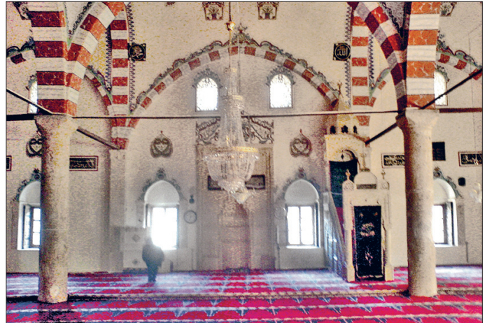
Yûsuf Ziyâ Paşa Camii'nin içinden bir görünüşü

Harimi ve son cemaat yerini süsleyen kalem işlerinde genel hatlarıyla barok özellikler görülmektedir. Yapıdaki bütün kemerlerde iki renkli taş taklidi boyamalar vardır. Her iki yönde orta eksendeki kemerlerde ayrıca barok desenler işlenmiştir. Diğer kemerlerde ise palmet benzeri bir dizi yer almaktadır. Kubbe ve tonozla-