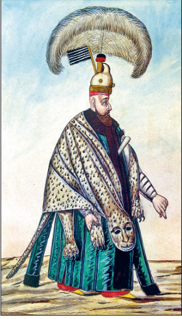
Zağarcıbaşı (Elbise-i Atika-i Osmâniyye, İÜ Ktp., TY, nr. 9362, vr. 23 a )