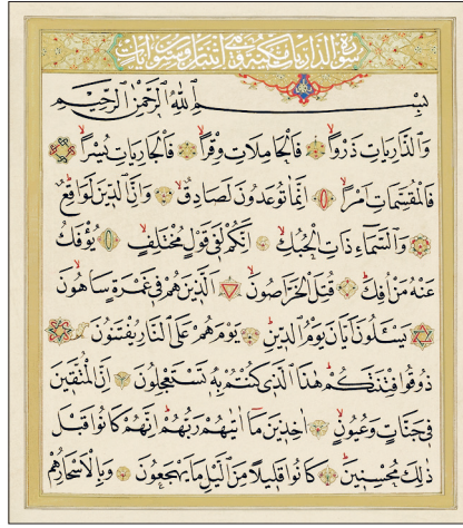
Zâriyât sûresinin ilk âyetleri

Adını "savuran rüzgârlar" anlamındaki ilk kelimesinden alır; "Ve'z-zâriyât" diye de anılır (Buhârî, "Tefsîr", 51). Nübüvvetin Mekke döneminin ortalarında nâzil olmuştur. Altmış âyet olup fâsılası "ع، ف، ق، " harfleridir. Zâriyât sûresi İslâm akaidinin üç temel esasını teşkil eden Allah'ın birliği, âhiret hayatı ve risâlet konularını içerir. Bu muhtevayı iki bölüm halinde özetlemek mümkündür. Birinci bölüm âhiretin vukuu hakkındadır ve toz haline getirip aşılardan, bir yerden başka bir yere savuran rüzgâra, yoğunlaşır yağmur yükünü taşıyan bulutlara, denizde süzülüp giden gemilere, tabiatın işleyişini (yahut Allah'ın nimetlerini) düzenleyenlere ye-