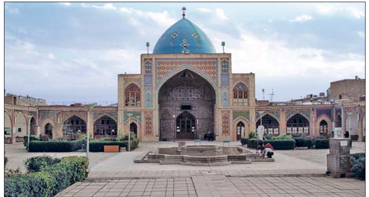
Mescid-i Câmi' - Zencan

1382-1383 yıllarında Timur, Zencan ve civarındaki şehirleri ele geçirdi. 832'de (1428-29) Sultâniye, Ebher, Kazvin ve Zencan, Timurlular'dan İlyas Hocaoğlu Hoca Yûsuf'un idaresindeydi. Karakoyunlu İskender, Hoca Yûsuf'u esir alıp buranın idaresini Deli Ahmed ile Abdül'e verdi (Sümer, I, 127). Zencan, Safevîler devrinde Osmanlı İnan mücadelesine sahne oldu. Safevî Hükümdarı Şah II. İsmâil zamanında Gîlân'dan Osmanlı ülkesine gitmekte olan bir Türk kervanı Zencan'da baskına uğradı, malları yağma edildi ve tâcirlerin çoğu öldürüldü (Kütükoğlu, s. 16-17). 2 Şevval 1136'da (24 Haziran 1724) İstanbul Muhâdese (İran Mukâsemenâmesi) adı verilen antlaşmaya göre İran toprakları Osmanlılar ve Ruslar tarafından taksim edildi. II. Tahmasb'a sadece Hazar denizinin güneyinde Tahran, Kazvin, Reşt ve Zencan ile Kum şehirleri kaldı (Aktepe, s. 31-32). Daha sonra yapılan bir antlaşmayla Hûzistan, Zencan, Kazvin ve Sultâniye de Osmanlı idaresine geçti. Zencan 1197'de (1782-83) Kaçarlı Ağa Muhammed Şah'ın hâkimiyetine girdi. Safevîler'in sonlarına doğru Zen-