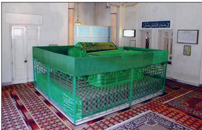
Zerrûk'un Mısrate'deki türbesinin içinden bir görünüşü