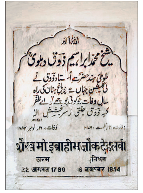
Muhammed İbrâhim Zevk'in mezar taşı

zım'ın Sind'e gitmesi üzerine veliahdın hocalığını üstlendi.