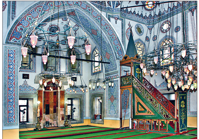
Zeyneb Sultan Camii'nin harim kısmından bir görünüşü

Sıbyan mektebi külliyesinin batı girişi bitişğinde yer almaktadır. Cami zemininden yüksek bir merdivenle ulaşılan mektebin girişi kuzeydendir. Yuvarlak kemerli üç açıklığa sahip revakın batı tarafında dışarıya gelen yan kısmı kapalı tutulmuştur. Cephelerde birinci sırada dikdörtgen, lokma parmaklıklı açıklıklar, üstünde ise yuvarlak kemerli filgözü dışlıklar alçı pencereler görülür. Mektebin kare planlı dershanesi alçı şebekeleri ve tavanı dahil olmak üzere 1980'li yıllarda yeniden yapılmıştır. Külliyeye sonradan ilâve edilen Hamidiye