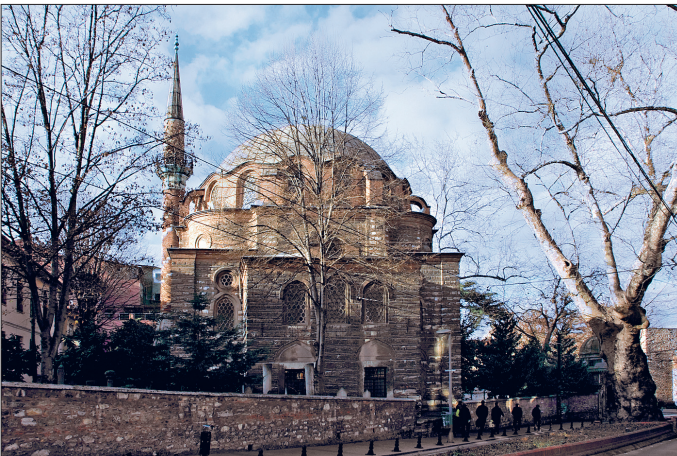
Zeyneb Sultan Camii – Eminönü / İstanbul

Gülhane Parkı karşısında eğimli ve dar bir araziye yerleşen külliye binaları ihata duvarıyla çevrili, doğu ve batı yönünde iki girişi bulunan bir bahçe içerisinde yer alır. Sıbyan mektebinin olduğu batı tarafındaki kapı üzerine "Duâcızâde" imzalı, 1183 (1769) tarihli, celif sülüsle Yâsîn sûresinin 58. âyeti yazılmış, kitâbenin üstü mermer bir tepelikle taçlandırılmıştır. Külliye arsasının eğimi ve yükseklik farkı cami, sıbyan mektebi ve medresenin kat görünüşlerini