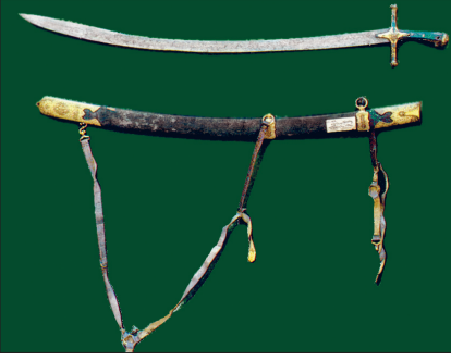
Zeynelâbidîn'e nisbet edilen kılıç (TSM, Mukaddes Emanetler, nr. 21/139)