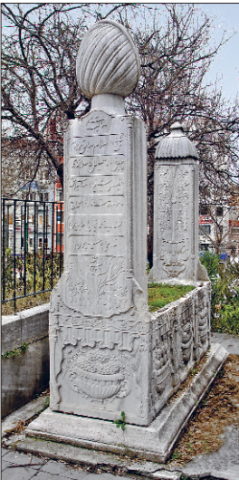
Zeynelâbidin Efendi’nin mezarı

Sühreverdiyye tarikatının Zeynüddin el-Hâfî’ye (ö. 838/1435) nisbet edilen bir kolu.